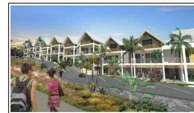
Commune de Saint Leu