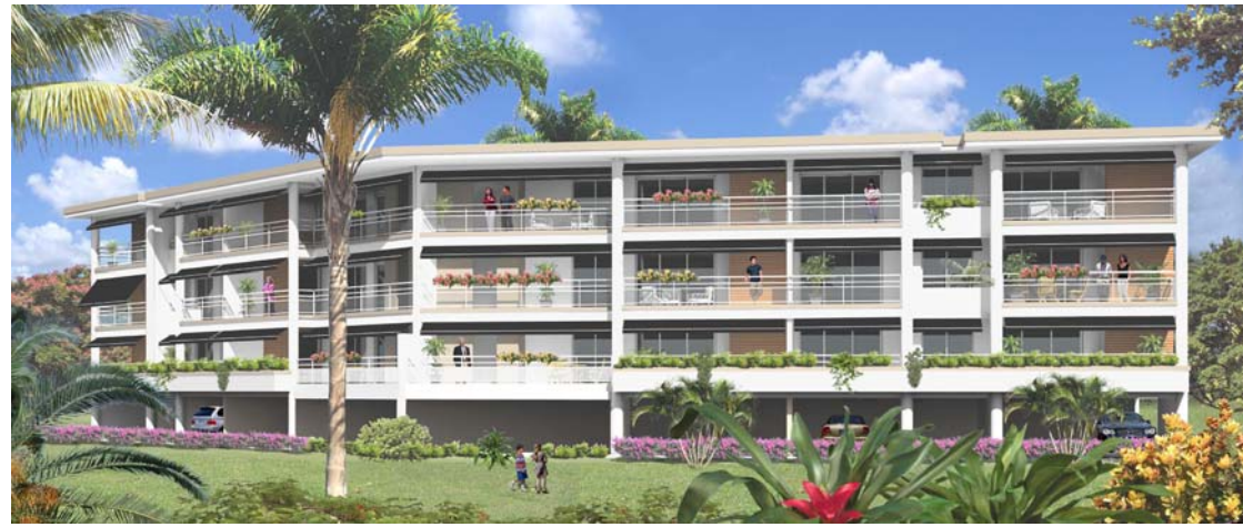
Bernard LECLERCQ Architecture SARL DOCUMENT NON CONTRACTUEL

PROVISOIRE: Plans de vente établis d'après demande de permis de construire. Les surfaces définitives seront précisées en phase EXE